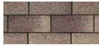
Weatherwood · Bois de grange