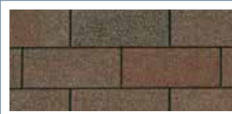
Aged Redwood · Séquoia vieilli