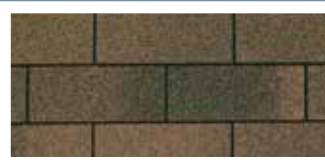
Dual Brown · Brun double