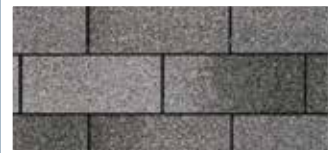
Charcoal Grey · Gris charbon