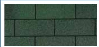
Vintage Green · Vert antique