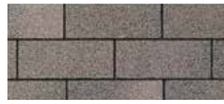
Driftwood · Bois flottant