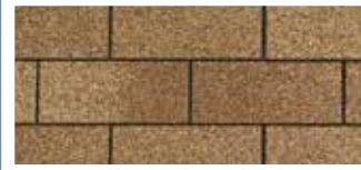
Earthtone Cedar · Cèdre « Earthtone »