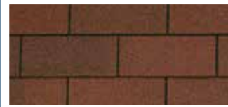
Riviera Red · Rouge riviera