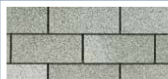
Dual Grey · Gris double