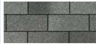
Harvard Slate · Ardoise « Harvard »