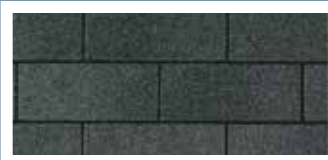
Dual Black · Noir double