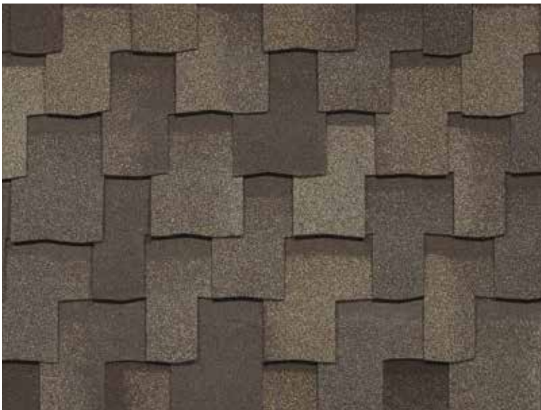
Armourshake - Pierre tempérée