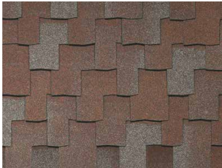
Armourshake - Séquoia de l'Ouest