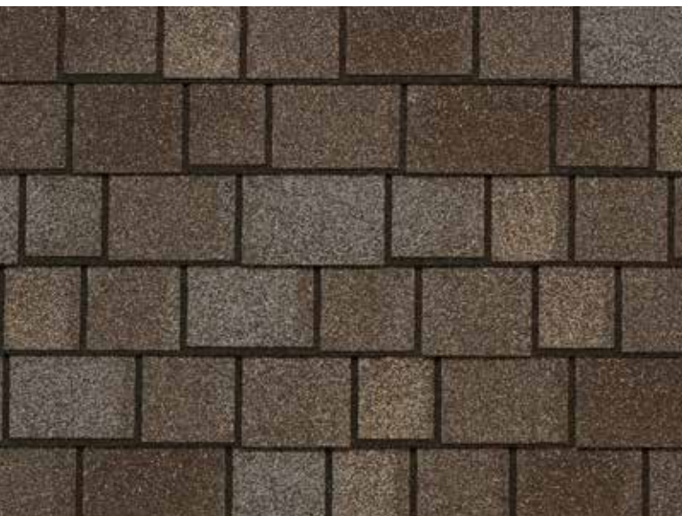
Royal Estate - Ardoise récolte