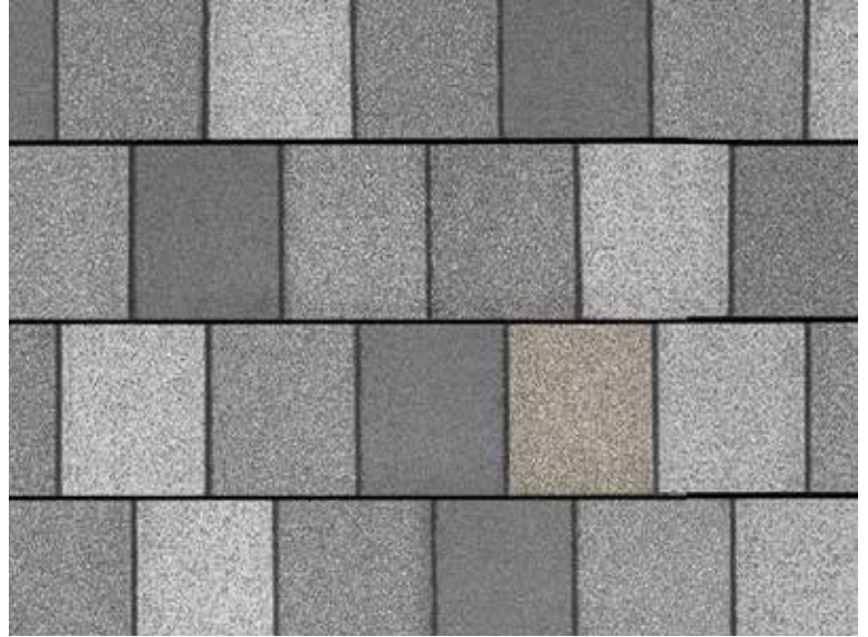
Crowne Slate - Rocher majestueux