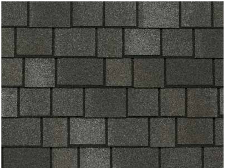
Royal Estate - Ardoise de montagne