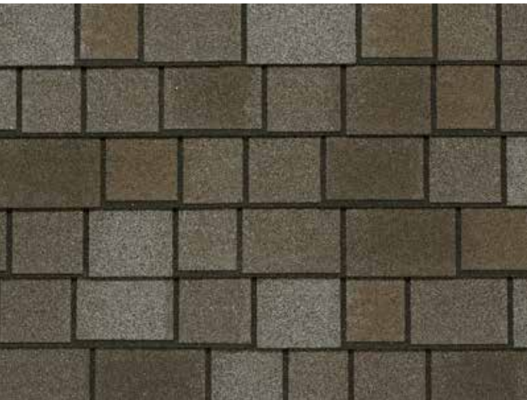
Royal Estate - Ardoise taupe