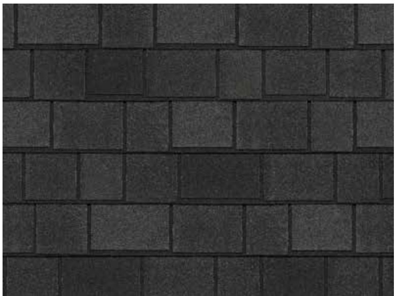
Royal Estate - Ardoise ombragée