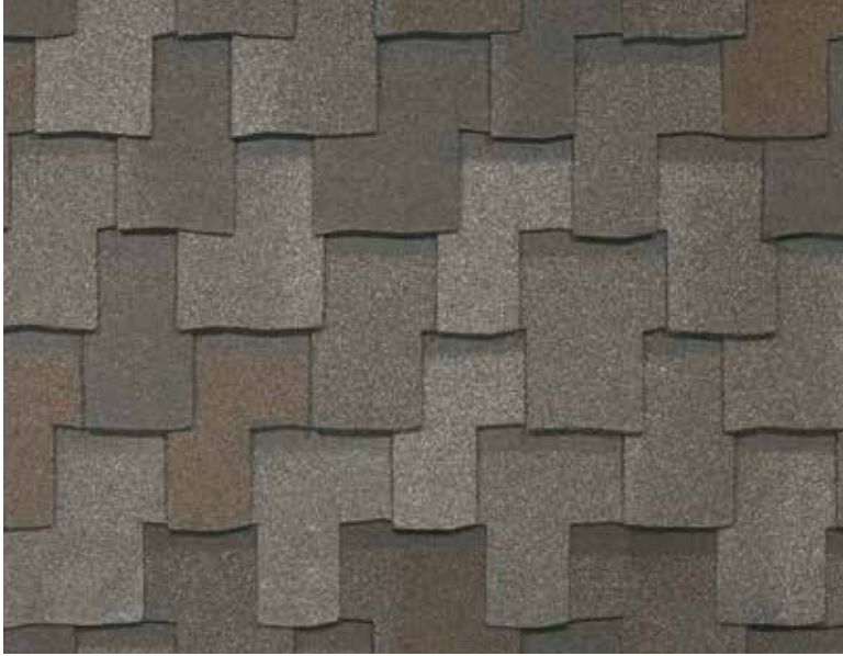
Armourshake - Chalet de bois