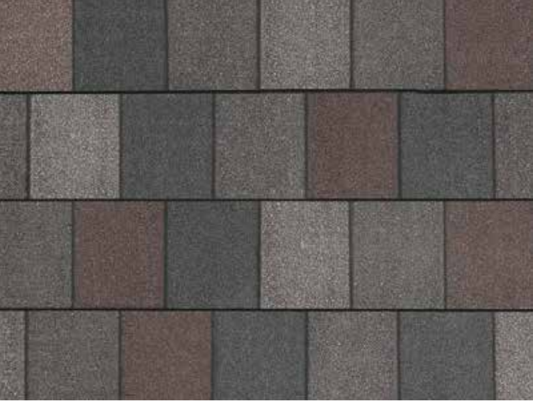
Crowne Slate - Granit royal